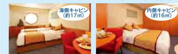
写真はキャビンの一例です。

陽気で気さくな個性が光るコスタクラシカは、コスタ船団の中で最も愛されている客船のひとつです。改装を終え、さらに美しく、快適にリニューアルしました。精巧な壁面がルネッサンス期や古代ローマのたたずまいを再現したチボリレストラン。ブッチェニダンスホールでは、ブッチェニの有名なオペラの場面が描かれたテーブルが目を見せます。船内最上部に位置する展望台は、太陽が沈むとスタイリッシュなディスコに変身。ここから眺める360度に広がるパノラミックな眺望は圧巻です。