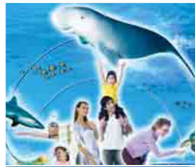
アンダーウォーターワールド アンダーウォーターワールドは、近海の海洋生物をご覧いただける、セントーサ島内の有名な海洋水族館です。魚にエサを与えたり、イルカのショーなど家族で楽しめる観光スポットです。