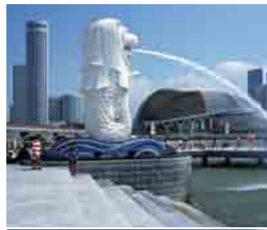
マライオン シンガポールのシンボル、マライオン。上半身がライオン、下半身が魚になっています。高層ビルを背景に立つ姿は実に凛々しいです。